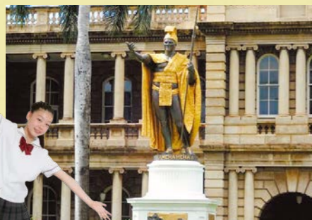
King Kamehameha Statue